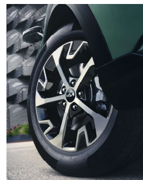
Jante aliaj de 18"