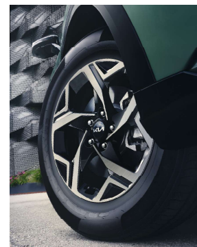
Jante aliaj de 17"