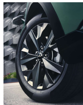
Jante aliaj de 18" - GT-line